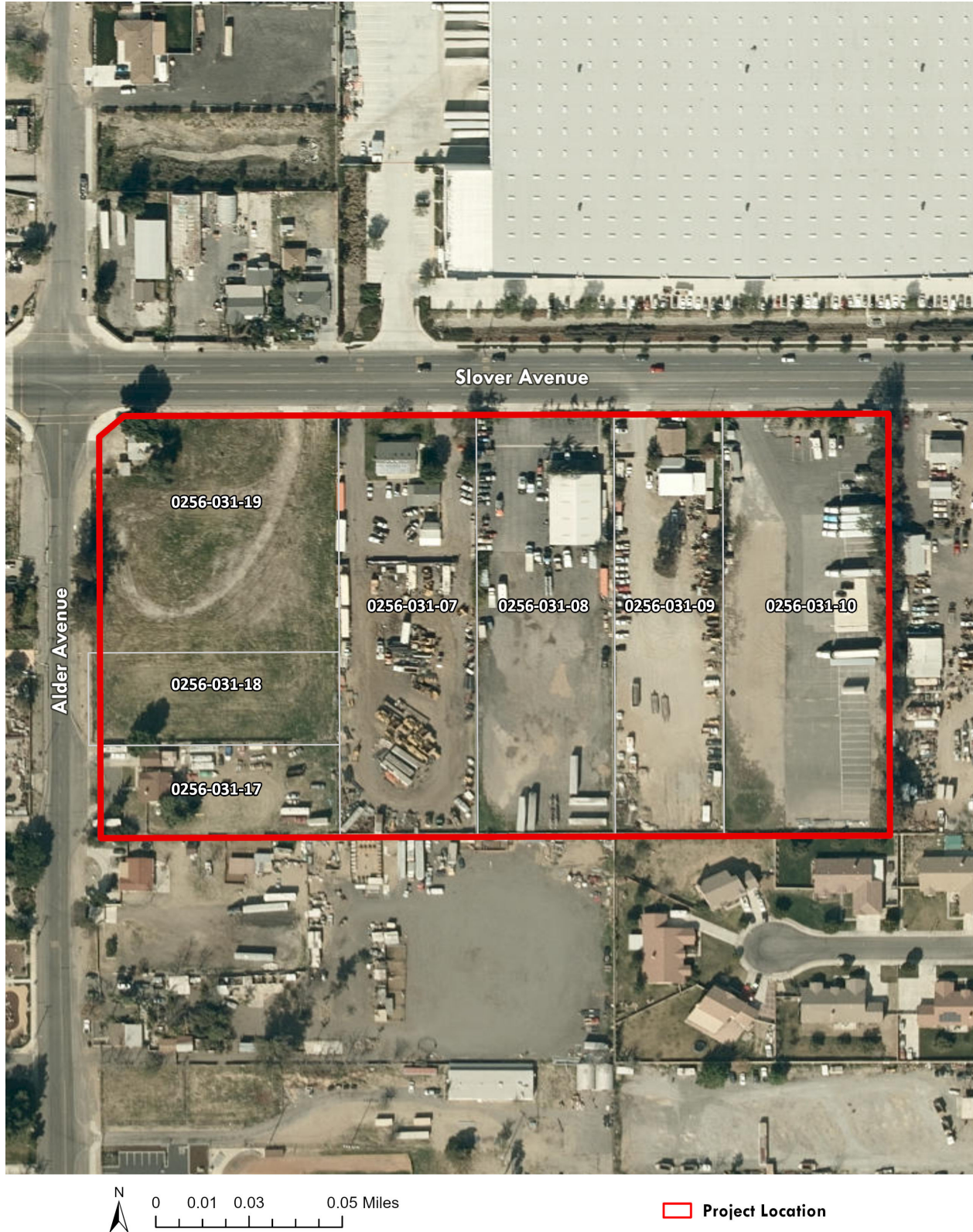
Duke Warehouse on Slover & Alder